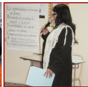
Misión en el Sur y otros sitios... Roperos Ctarios; tejidos de abrigo y mantas; Cáritas; atención comedores y la salud... "Espacio Familia"; DDHH...

Desde el mismo Encuentro se vivió este gesto fundante que es la solidaridad: la Red Laical de Argentina entregó una contribución a las Hnas de B° Mitre, Buenos Aires, para necesidades de la gente del B° porque hace muy poco sufrieron una grave inundación.